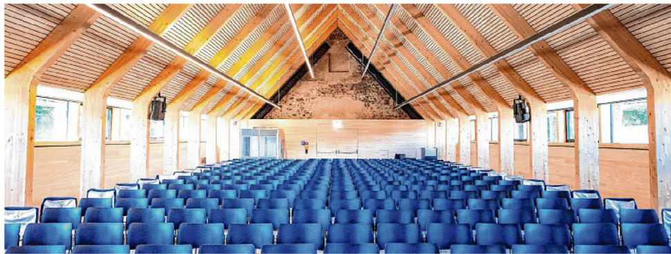
Eindrucksvolle Raumwirkung: Die Aula als neuer Versammlungsraum in der Schrote.

Doch auch ihre Verankerung in der Region will die Schule künftig noch weiter stärken. Damit knüpft sie an den Geist der Schulgründer Prinz Max von Baden und Kurt Hahn an, die in ihrer